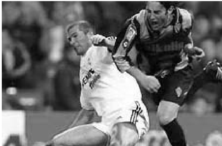
Partido anterior contra el Real Madrid

La treintena de presos sharauis que estaban en huelga de hambre desde hace 50 días anunciaron, el jueves por la noche, que cesaban su protesta en