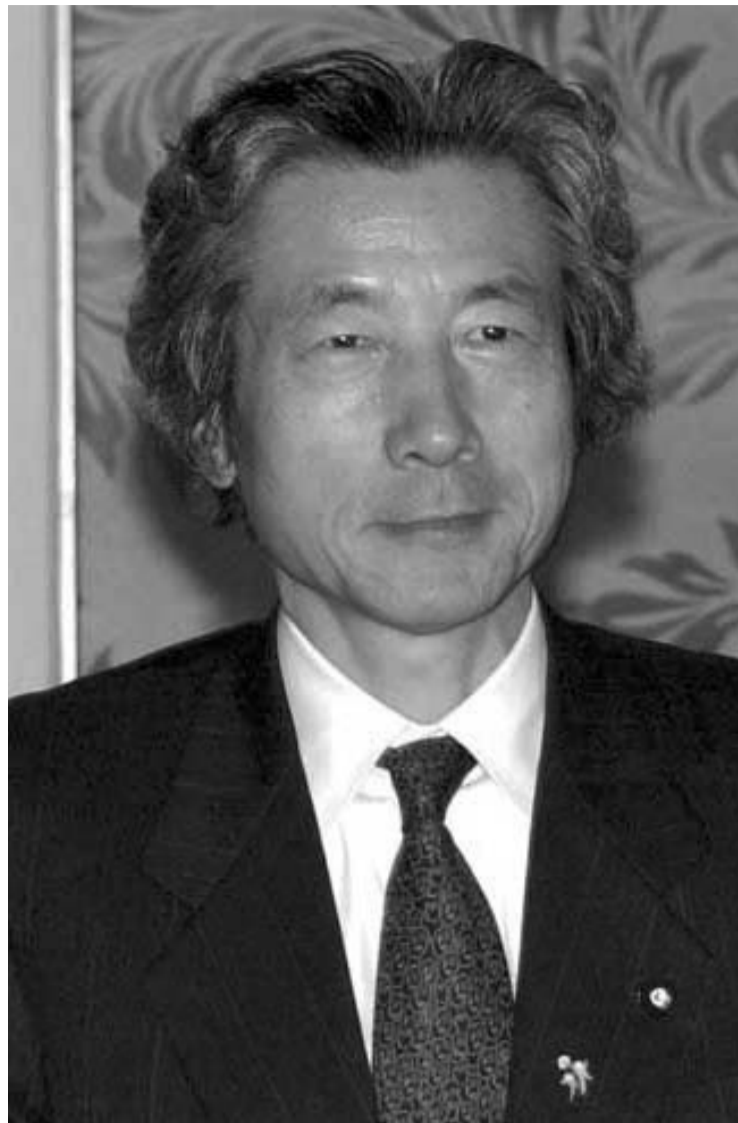
El ministro japonés en una foto reciente

La treintena de presos sharauis que estaban en huelga de hambre desde