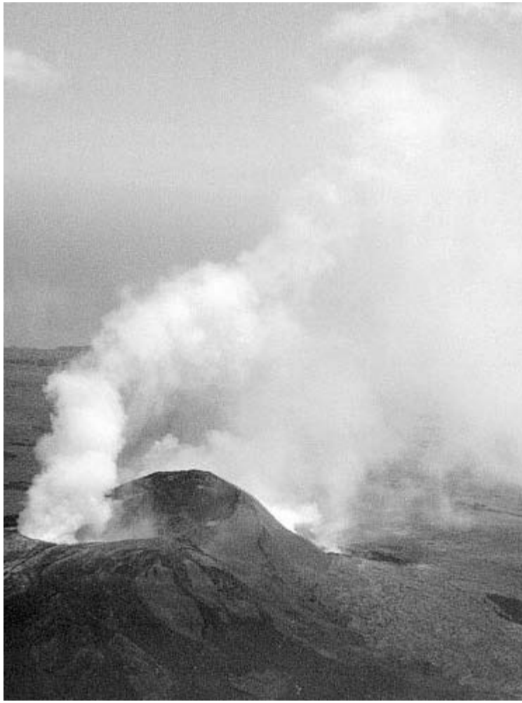
Expulsión de gases de un volcán en Rusia

dió con el fin de la cumbre hispano-marroquí de Sevilla. Personas afines a los huelguistas indicaron que su intención era hacer durar su protesta amiento en El Aaiún. El anuncio del cese de la huelga coincidió con el fin