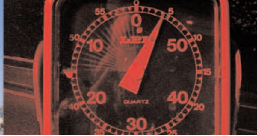
el tiempo es la clave para el