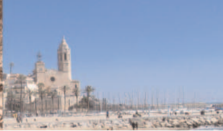
fotograma de "alla fuera es"