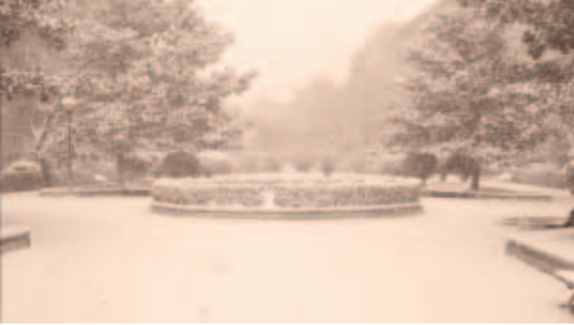
fotograma de "sin permiso"