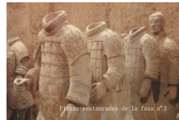
Piezas restauradas de la fosa n°3