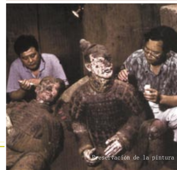
Preservación de la pintura