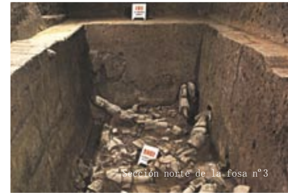
Sección norte de la fosa n°3