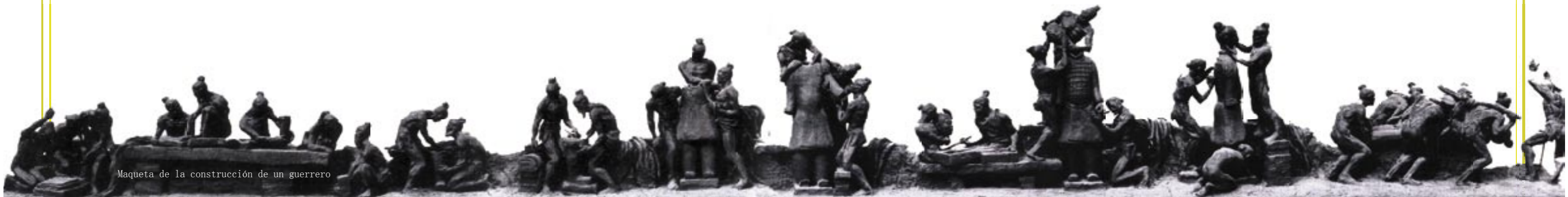
Maqueta de la construcción de un guerrero

Se nota que no todas las figuras son del mismo nivel estético o tecnológico. Hay unas que pueden ser verdaderas obras de arte en todos los sentidos de las palabra, y hay también, aunque son muy pocas, algunas otras que están casi mal hechas. Los especialistas ven que algunas figuras llevan grabados o sellados en el cuerpo signos, tales como Gongde, Gongjiang o Gongxi. Sabemos que eran nombres de los talleres oficiales. Aparecieron también otras grabaciones como Xianyangfu, Xianyangyi, o Yueyangzhong que eran nombres de algunos talleres privados.