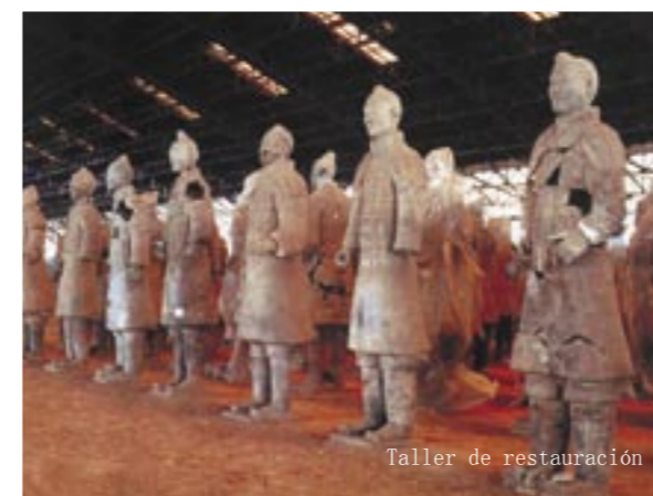
Taller de restauración