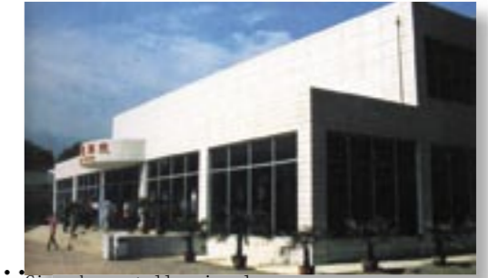
Cine de pantalla circular