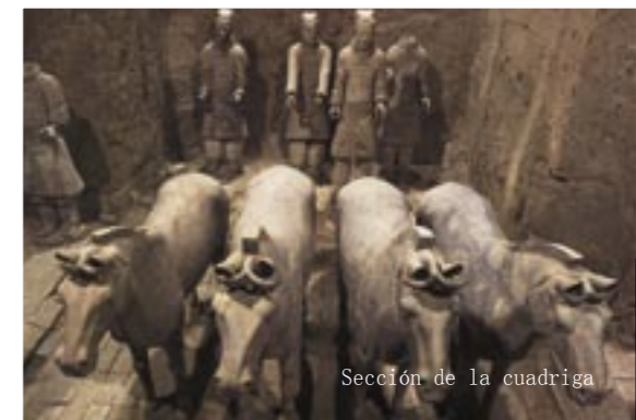
Sección de la cuadriga