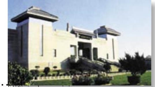
Edificio de exposiciones