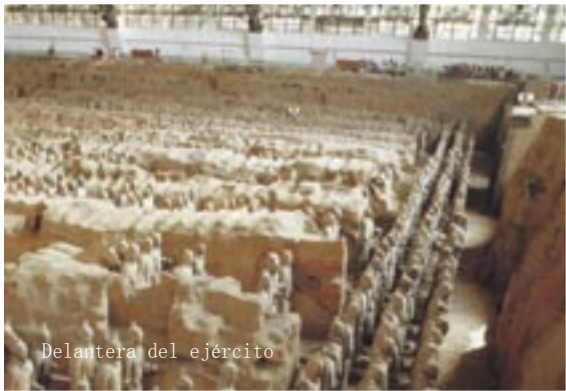
Delantera del ejército