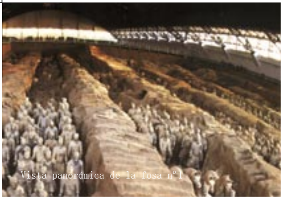
Vista panorámica de la fosa n°1