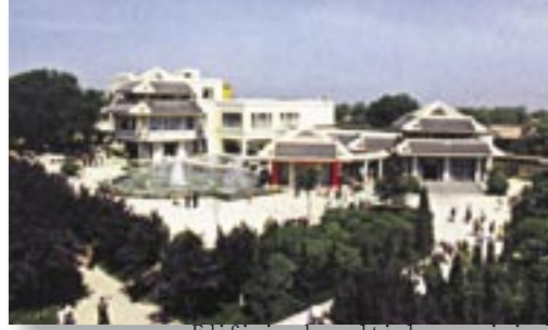
Edificio de multiple servicios