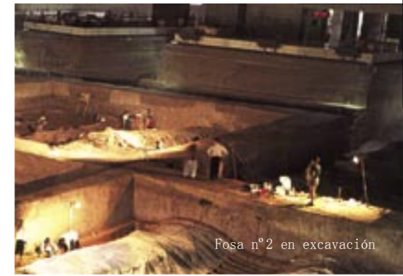
Fosa n°2 en excavación