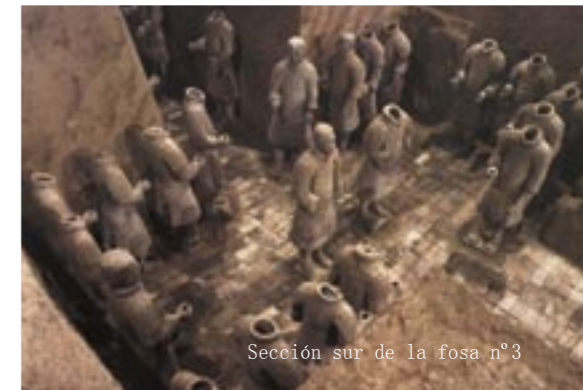
Sección sur de la fosa n°3